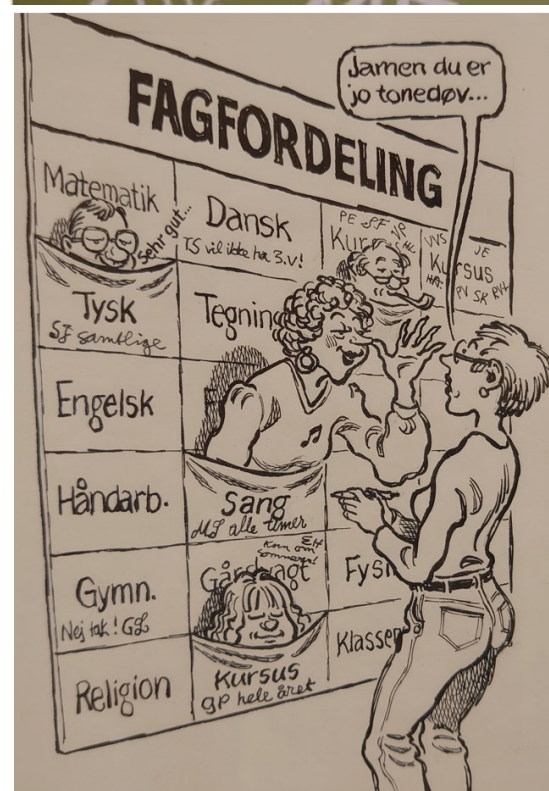
Tegnet af Klaus Albrechtsen