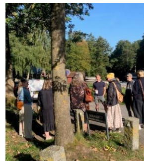
Forberedelse til tale