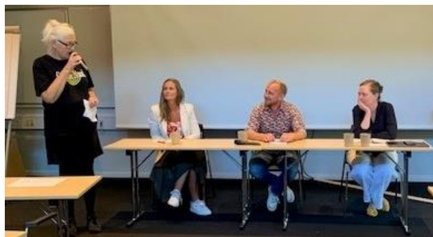
Paneldebat ved medlemsweekenden