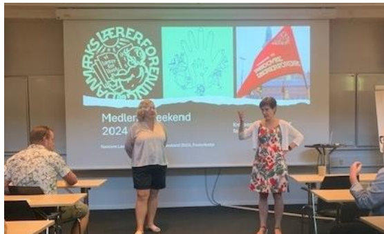
Velkommen til medlemsweekend