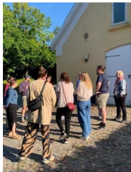
Forberedelse til tale