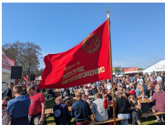
Fanen 1. maj i fælledparken