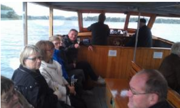
”De gamle” på tur

Henover morgenbuffeten på Hotel Frederiksdal søndag morgen blev medlemsweekenden udråbt til den bedste medlemsweekend nogensinde. Om det skyldes den vellykkede fest lørdag aften i kælderen, turen på vandet eller det spændende og varierede program for weekenden vides ikke. Men mon ikke det var en kombination. Medlemsweekenden var nemlig en stor succes på alle fronter.