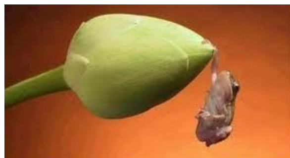
OK13 er noget af en "cliff hanger"

I Rødovre Lærerforening brugte vi forud for kongressen meget tid på at diskutere, hvilke muligheder der kunne være for at vende et begyndende mismod blandt medlemmerne til en fortsat tro på, at vi også på centralt forhandlingsniveau kan få en mere konstruktiv dialog om kvaliteten i undervisningen. Samt hvordan vi i fællesskab løfter de udfordringer, vi står overfor.