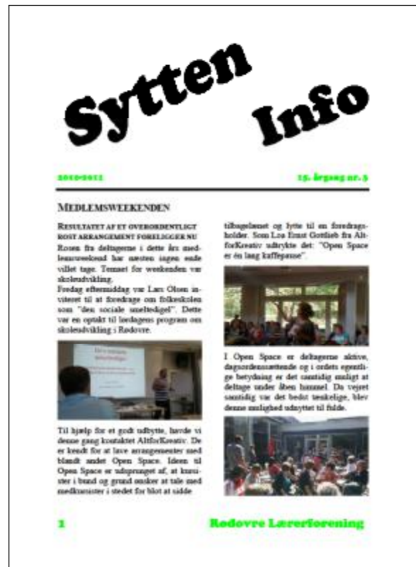
Las mere om medlemsweekenden i 17info nr. 3 2010/11

gementet, og medlemmerne på Islev Skole, der tog initiativet og sørgede for arrangementet, skal have stor tak for deres indsats.