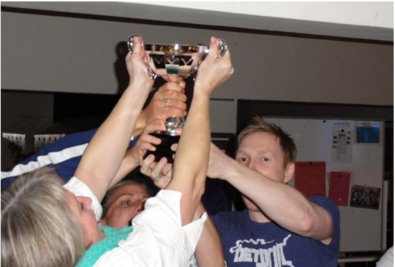
"Hockey og Hygge" på Islev Skole januar 2012