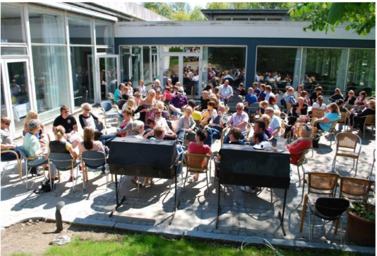
Mellensweekenden Frederiksdal i maj 2011: "OPEN SPACE" - Debatintensiteten var høj og vejret strålende