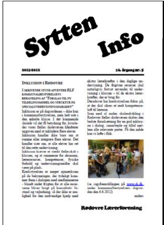
Læs mere om inklusion i 17info nr. 5 2011/12 på www.kreds17.dk

Med udgangspunkt i de positive erfaringer med skoleudvikling (herunder FUEL), ser kredsstyrelsen frem til at samarbejde om inklusionen, da vi endnu intet har set hidtil